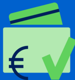
E-inkomen geverifieerde inkomensgegevens