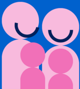
Koppel met kinderen