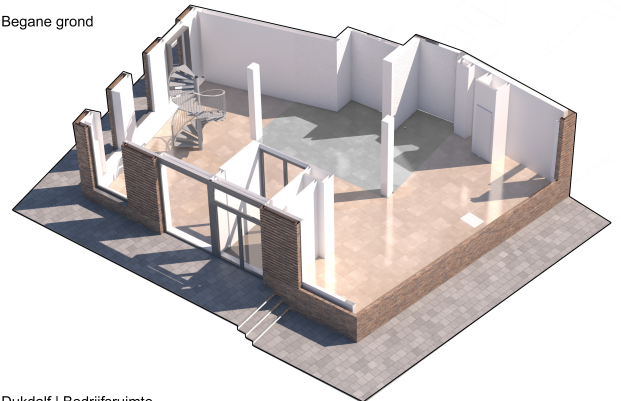
Dukdalf | Bedrijfsruimte indeling ter indicatie

Aan deze afbeelding kunnen geen rechten worden verleend